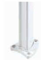
Haltepfosten fix verschraubt