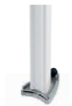
Haltepfosten mit Schnellverschluss (schnelle Entfernung des Pfostens möglich)